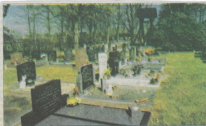
Recente opname van de begraafplaats aan de Bjirkewei te Twijzelerheide. De armvoogdij van Twijzel zorgde ervoor dat rond 1866 deze werd aangelegd.

DIT WAS EEN PUBLICATIE NAMENS DE STICHTING OUD-ACHTKARSPLEN